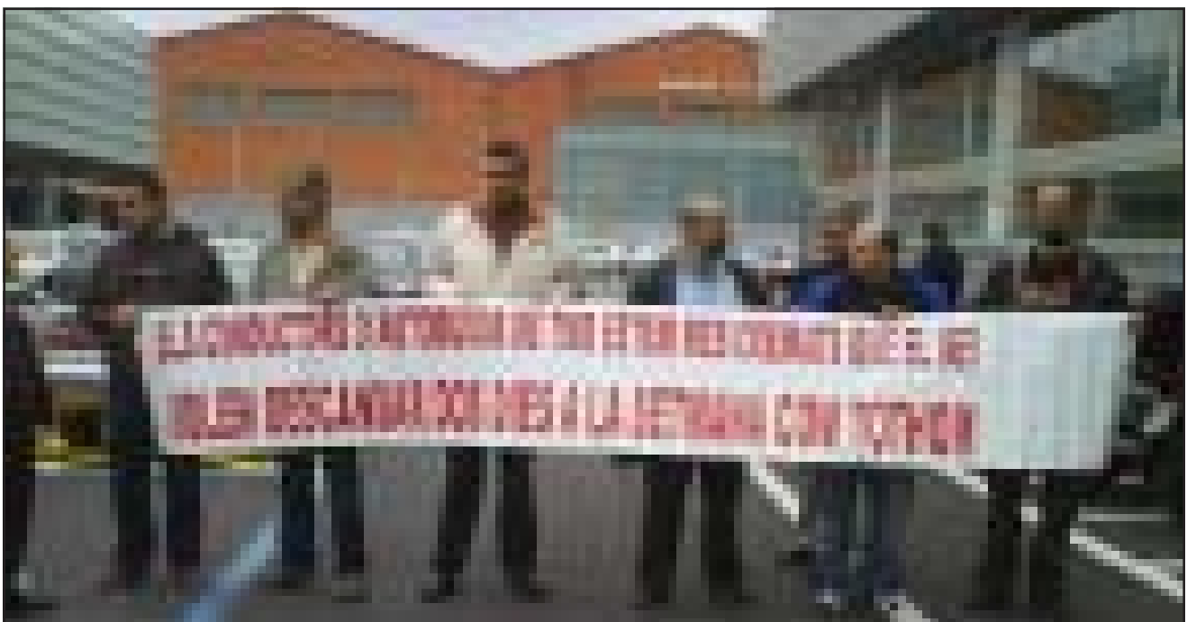
Compañeros del Comité de Descansos recibiendo al Vicepresidente y al Consejero Delegado de TMB

Son muchos los compañeros/as que nos preguntan