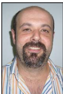
Nico para los amigos 12937 para los directivos

Desde el 15 de Septiembre tanto los trabajadores de TB como nuestros usuarios venimos sufriendo una reducción en el servicio que prestamos. Una reducción que tanto el alcalde como los dirigentes políticos de TMB se empeñan en negar.